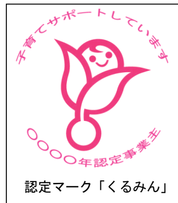
認定マーク「くるみん」