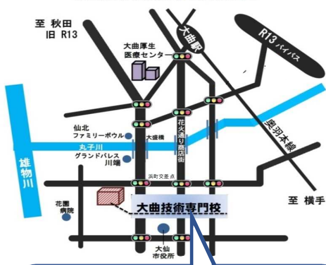
秋田県立大曲技術専門校の案内図