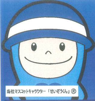
当社マスコットキャラクター「せいぞうくん」®

※上記以外にも各営業所・オフィスがございます。他拠点の詳細につきましては、裏面をご確認ください。