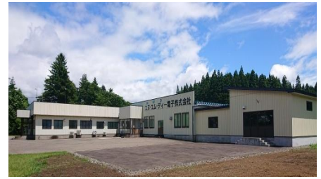
外観写真・ロゴなど

私たちは、トランス（変圧器）を専門に製造・販売している電子部品メーカーです。お客さまのニーズに合わせた設計およびカスタマイズを行っており、私たちの製品は大手家電メーカーをはじめ、通信機器、産業機器の分野まで幅広く活用されています。市場の変動に対しても柔軟な対応を行っており、業績は極めて安定しています。