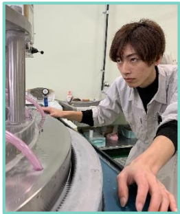
2019年3月入社 結晶事業部 製造課勤務