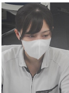
平成31年4月入社 作図担当