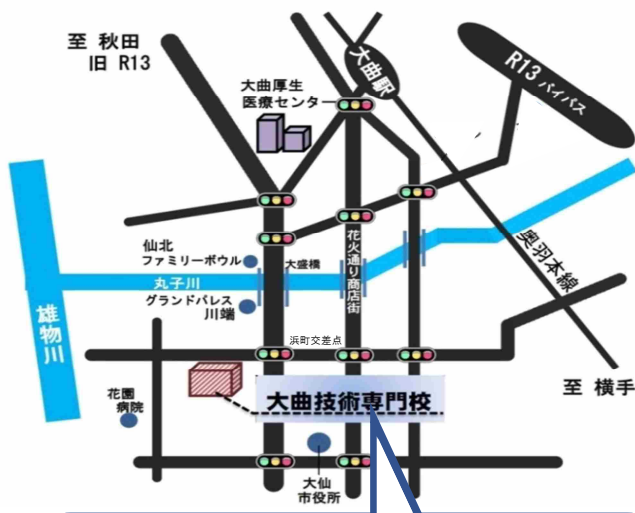
秋田県立大曲技術専門校の案内図