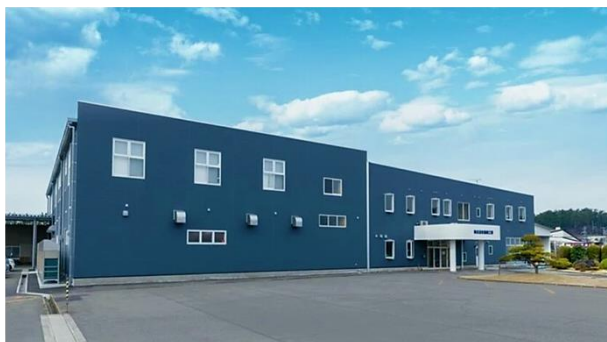
▲株式会社協和工業 外観

当社は製造業ですが、女性従業員の比率が高いのも特徴です。現場や社内外での研修、資格取得等で知識と技術を磨くことで、男女関係なく活躍できる会社です。