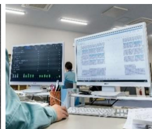
▲独自の生産管理システム