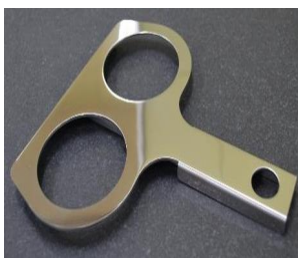
▲キズの無い製品(手術用器具)