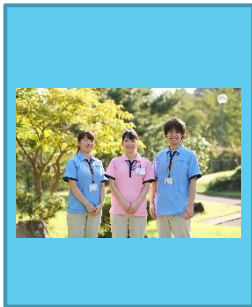
平成31年4月入社 あまさぎ園 1階療養棟勤務

由利本荘市岩城亀田地域で高齢者介護事業を通して地域に根差した社会貢献に取り組み、利用される方も働く職員も充実した生活が出来るよう福利厚生にも力を入れています。