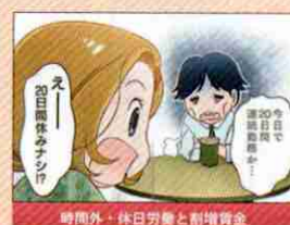
時間外・休日労働と割増賃金