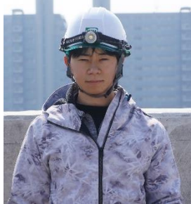
平成27年8月入社 左官技士