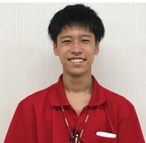
令和2年4月入協 共同購入能代センター 地区担当

～ “生協” と “あなた” が地域の支えになる～ 地域の方々の暮らしに貢献するため、豊かなくらしを守るために、共同購入・店舗・共済・灯油事業に取り組んでいます。