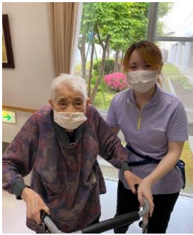
令和3年4月入社 ケアホームおおゆ 多床棟勤務