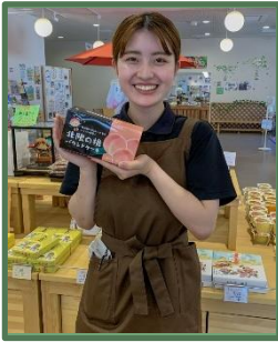
平成31年4月入社 販売課勤務

鹿角の観光拠点となる道の駅を運営しています。特産品の販売や郷土料理の提供、花輪ばやしの屋台展示など、鹿角の魅力を堪能できる観光施設です。旅行カウンターやDMO推進室も併設しており、PR活動や旅行商品の作成なども行い、様々な方面から鹿角のPRに力を注いでいます。