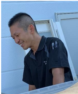
平成23年4月入社 リフォーム事業部 リフォーム工事チーム

「全従業員の物心両面の幸福を追求すると同時に、地域の発展とお客様の安心・快適な住環境を創造し、感動を提供します。」を経営理念に掲げ、住まいに関する幅広い事業を展開しています。