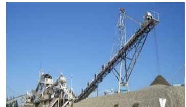
プラント生産工場