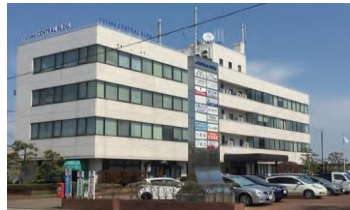
本社（湯沢セントラルビル）

創業 71 年を迎える当社は、湯沢市の発展と共に歩んできました。昭和 43 年には秋田県第 1 号の砂利採取業の登録を受けました。高品質の骨材（砂利・砂等）を一貫生産するほか、土木工事・解体工事から、湯沢市民に頼りにされる廃棄物収集事業まで、多岐にわたる事業を展開しています。キーワードは、大型特殊車両のプロ集団、職人技の除雪作業、災害時のインフラ復旧対応など、地域の皆様のお役に立てる、誇りの持てる仕事です。従業員への無利子貸付制度など、福利厚生制度も充実しています。