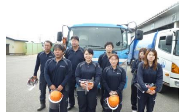
一般・産業廃棄物 収集・運搬