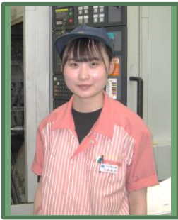
令和3年4月入社 第3工場 機械2課勤務

～0から100まで全てを請け負う会社～ 弊社は、装置の設計から加工、組立・配線、 据付調整までの一貫生産を得意としています。 様々な製造工程のプロに挑戦できる会社です！