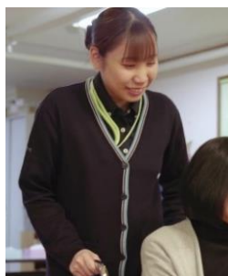
平成30年4月入社 デイサービスわかば リーダー