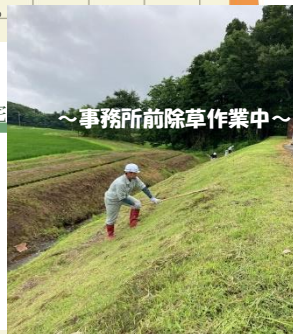
～事務所前除草作業中～