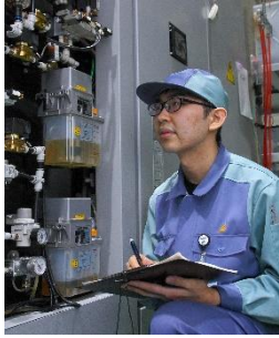
令和2年4月入社 ME事業部 部品製造部 部品製造課勤務

秋田精工株式会社は、「創造によって地域社会に貢献する」ことを企業理念に掲げ、ものづくりに挑戦し続けるYURIホールディングスの一員です。電子部品、半導体関連の自動化・省力化機械の製造のほか、昨今では航空機事業への取り組みも新たに挑戦しています。