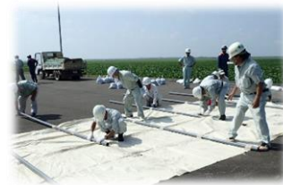
防災訓練でシート張り