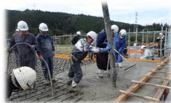
コンクリート打設

弊社は一郎湯干拓の時代に創業し、それ以降、地元地域社会の暮らしを支えるインフラ整備を担う総合建設業として事業を行っています。「顧客の求める品質で地域に貢献する」をスローガンに、顧客満足度の向上・環境負荷の低減・社員の安全を3つの柱として、地域社会の共生を目指しています。