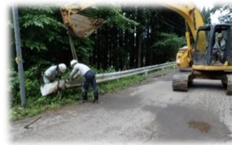
ガードレール補修で地域貢献