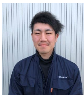
平成25年3月入社 秋田工場勤務