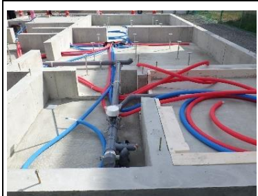
住宅 (床下) の水、お湯配管

※会社の特色 【当社 HP にて詳しく説明しています！】 1966年に創業し、長年にわたり大館の水に関わりライフラインを守って参りました。 市や県からの工事・福祉施設や住宅など、多種多様な工事を手掛けてきました。 資格取得にかかる費用は全額補助！先輩社員が培った知識と経験で何でも教えてくれます。