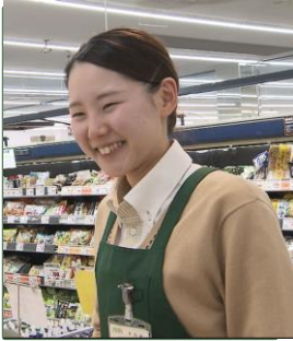
平成26年4月入社 日配部門担当

～秋田市内店舗数No.1～ アクセスが良く、通勤に便利です。 業務の機械化と省力化で、将来も地域一番店を目指します。