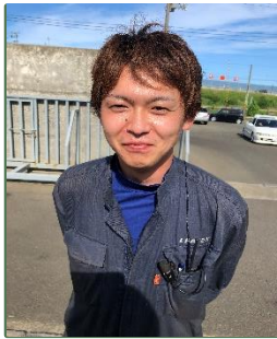
平成27年4月入社 秋田工場勤務