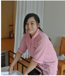
平成31年4月入社 きららアーバンパレス ショートステイ勤務