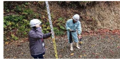
インターンシップの様子