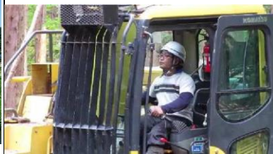
高性能林業機械作業[林業部]