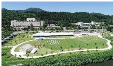
道の駅おおゆ[建築部]

明るく、元気に、前向きにやり遂げる皆さんの若い力に期待しております。当社の建設業・林業というフィールドで思いっきりチャレンジできる環境を整えてお待ちしております。Let's チャレンジ 石川組！