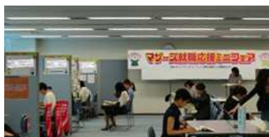
マザーズ就職応援ミニフェアの様子

平成27年9月11日(金)に、あいちマザーズハローワーク主催による「マザーズ就職応援ミニフェア」を開催しました。今回は、マザーズハローワークとして初めての「事務職限定」の就職フェアで、企業12社に対し、子育て中の女性等71名が来場し、各ブースにおいて説明を受けました。また、同時開催のセミナーにも16名の方が参加し、企業に応募する前の心構えについて受講しました。