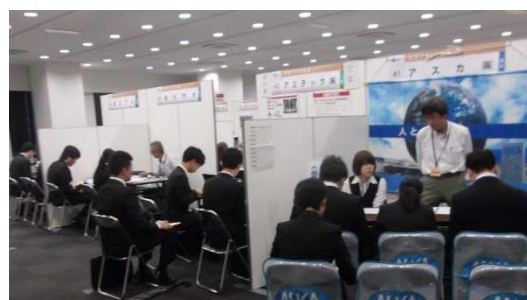
愛知ブランド企業・若者応援宣言企業 秋の就職フェア2015の様子

参加企業のアンケートには「前向きな方が多くいた」、「大変有意義でした」、「弊社に興味を持ってもらう良い機会となりました」、「この時期のイベント開催は毎年ありがたいと感じております」といった感想が寄せられました。