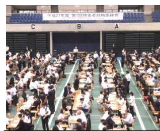
障害者就職面接会の様子

また、障害者雇用に積極的な2企業の事例紹介と28年4月1日に施行予定の改正障害者雇用促進法について解説を行い、障害者雇用への理解を求めました。