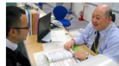
業界に精通した専任がマン・ツー・マンでサポート!