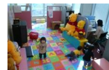
全オフィスに保育士を常駐安心してお仕事探しに専念