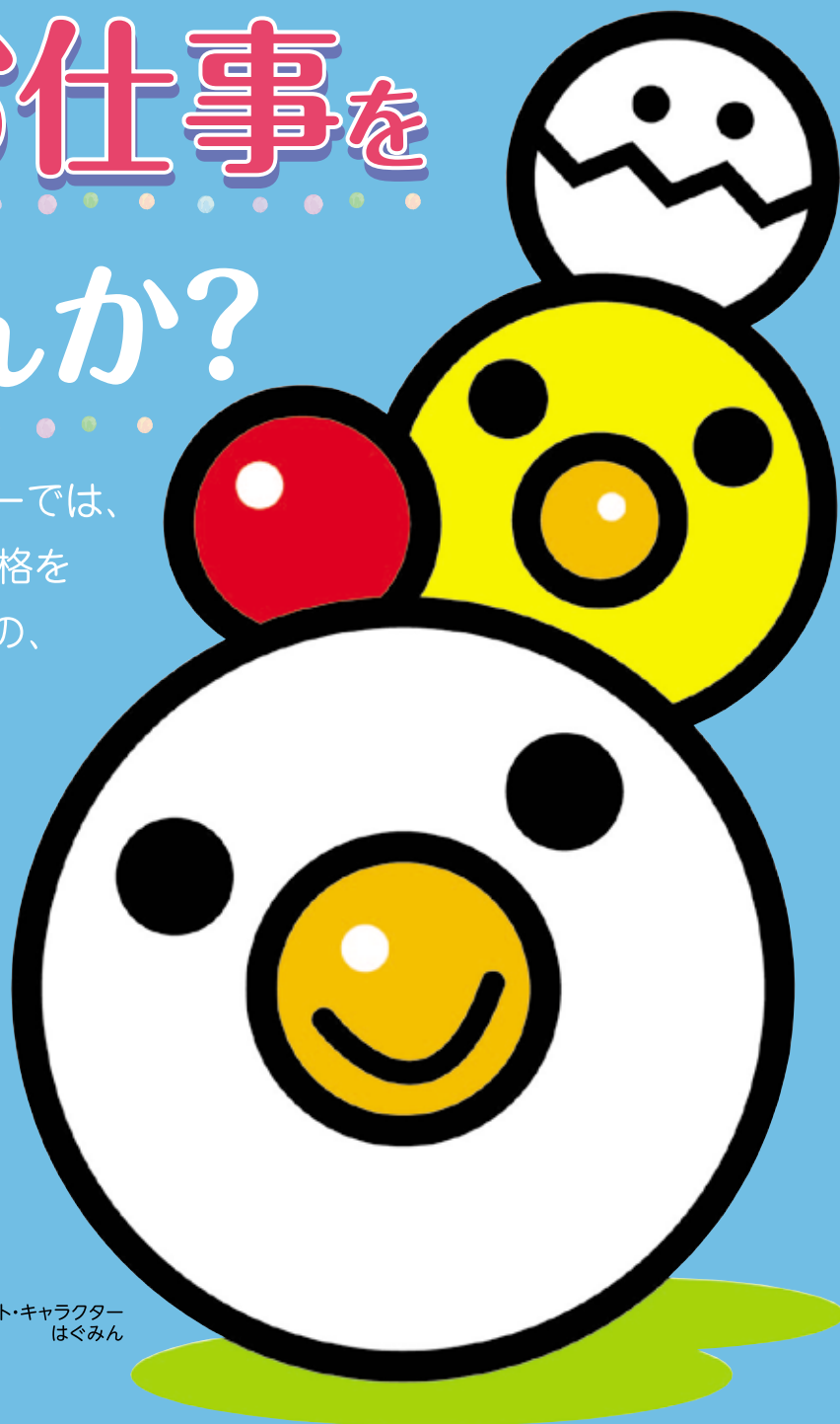
愛知県子育て応援マスコット・キャラクター はぐみん

愛知県保育士・保育所支援センターでは、 保育士経験のある方や、保育士資格を 有しているけれど働いていない方の、 就職の支援をしています