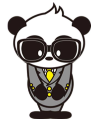
ハローワーク名古屋中 福祉人材コーナー マスコットキャラクター