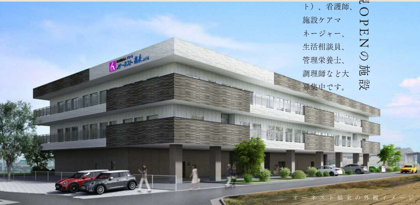
オーネスト福来の外観イメージ