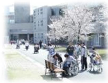
愛厚ホーム豊川苑

遊歩道や緑の丘、グラウンドがあり、 季節感溢れる豊かな環境です。 “笑いと笑顔 共に向上”を掲げて 生活づくりを支援しています。