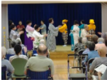
ボランティアによる日本舞踊