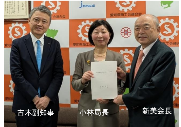
令和 7 年 1 月 27 日 愛知県商工会連合会