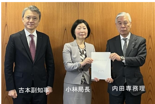
令和 7 年 1 月 31 日 愛知県商工会議所連合会