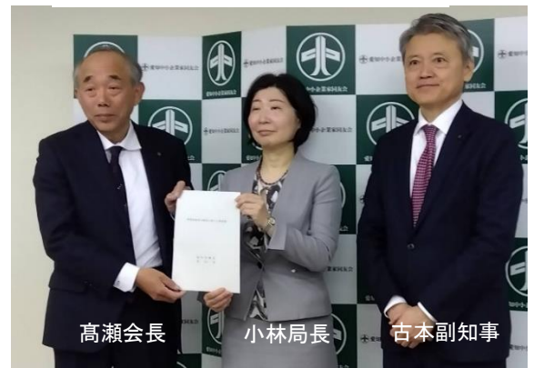
令和 7 年 1 月 31 日 愛知中小企業家同友会