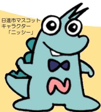
日進市マスコットキャラクター「ニッシー」