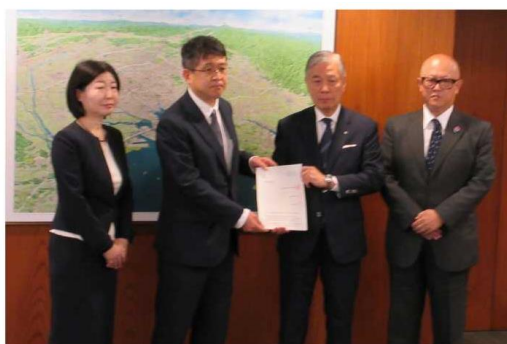
令和6年10月29日 愛知県商工会議所連合会