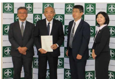
令和6年10月28日 愛知中小企業家同友会

本法が施行されるにあたって、愛知県内で本法を所管する公正取引委員会事務総局中部事務所、中部経済産業局、愛知労働局のそれぞれの長が、合同で、県内主要経済5団体に対して、本法の周知にご協力いただくよう要請しました。