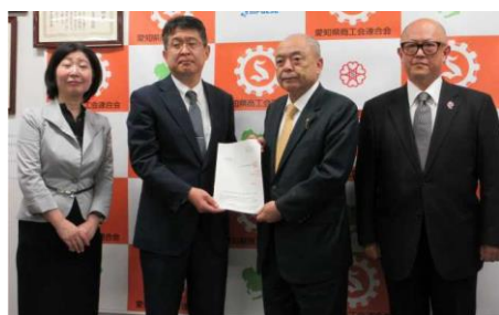
令和6年10月30日 愛知県商工会連合会