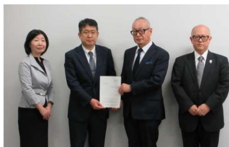
令和6年10月30日 愛知県中小企業団体中央会