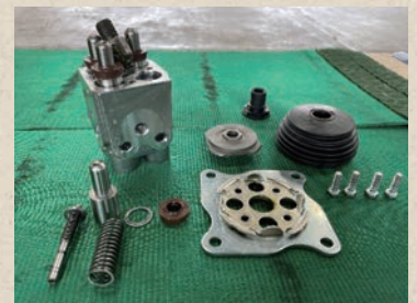
教材に掲載している写真の例 作業機PPCバルブ

A:先にも述べた通り、本教材は、在職者訓練の受講者の方が使用し、自身の企業に戻ってから“振り返りができる”、“活用できる”という現場に即した教材です。そのため、点検に使用する器具や機器については、ホームセンター等の店頭と並んでいるようなものを使用しています。…(つづきはHPで!)