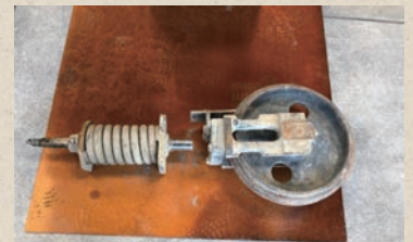
教材に掲載している写真の例 履帯調整シリンダ

出典:川橋 壮彦(2022年)、「建設機械の保全技術 ~現場で使える保守・点検~」 (第26回令和4年度職業訓練教材コンクール入賞教材作品)、 < https://www.tetras.uitec.jeed.go.jp/statistics/con-cours/22kyouzai/sakuhin >