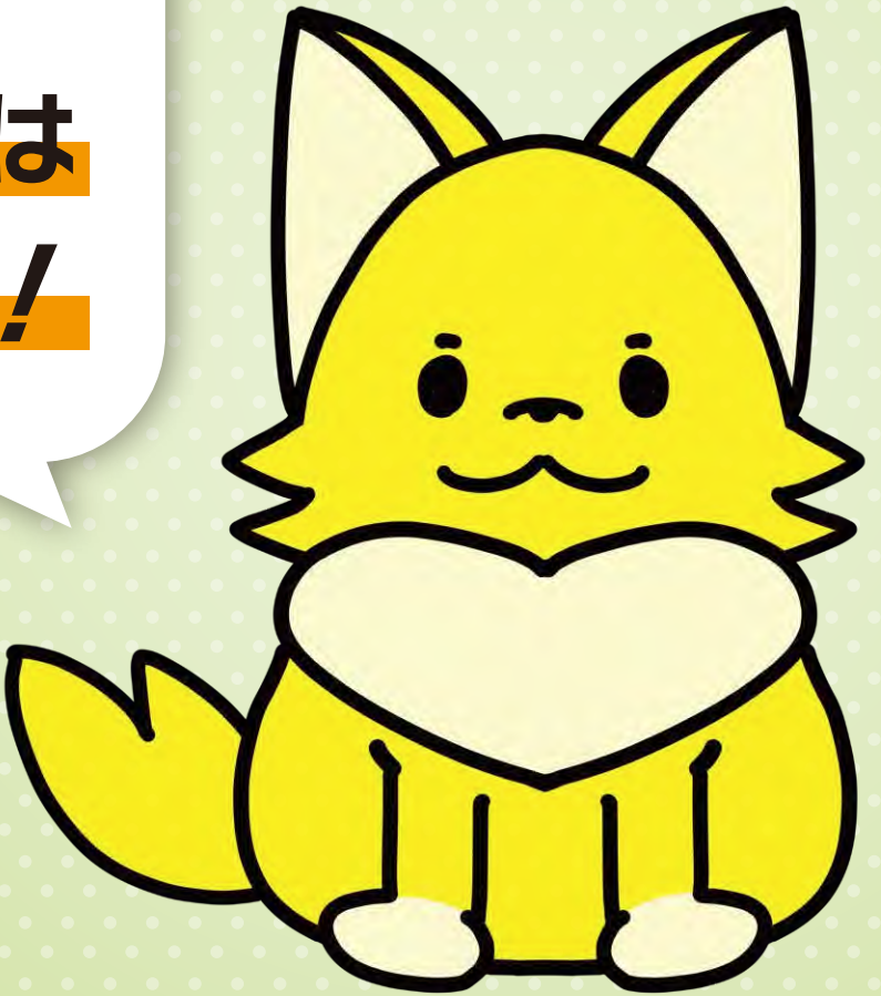
愛知働き方改革推進支援センター公式キャラクター アイチロちゃん

整った労働環境を好むキレイ好きなキツネ。 愛知労働局の「愛」とキツネ文化から生まれました。