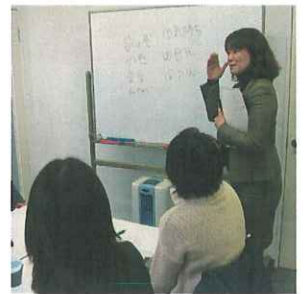
各種研修を実施。就業前には1人ずつ個別研修を行っています。