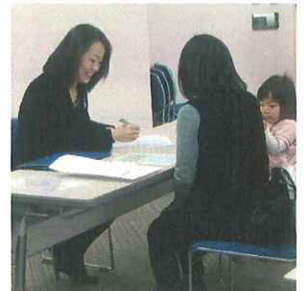
「お子様連れOK」の登録会も開催!