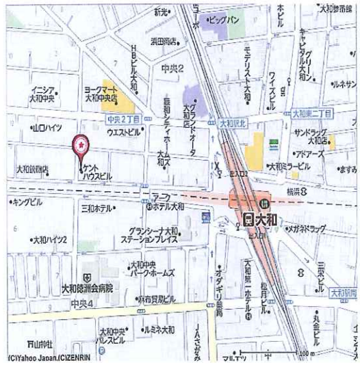
小田急線 相鉄線 大和駅より徒歩5分

給 与: 時間給、諸手当、有給休暇を含む総支給額 福利費等: 健康保険、介護保険、厚生年金、雇用保険、労災保険、健康診断等 会社運営費: 人件費、オフィス、事務経費、募集広告費等会社運営にかかる諸経費 営業利益: 上記経費を差引いた会社の利益