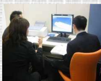
システム設計・開発風景