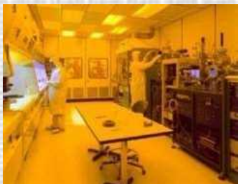
半導体工場での仕事風景