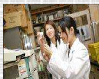
研究開発の仕事風景