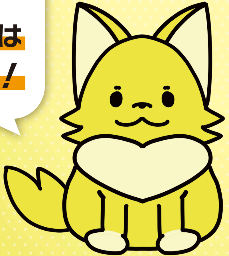
愛知働き方改革推進支援センター公式キャラクター アイチロちゃん

整った労働環境を好むキレイ好きなキツネ。 愛知労働局の「愛」とキツネ文化から生まれました。