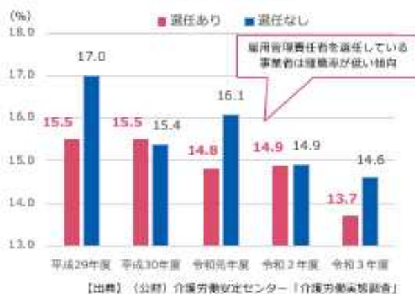
介護事業所の離職率