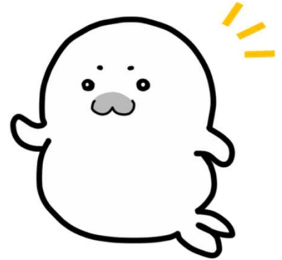
アザラシの氷河くん