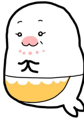
ひょうが 氷河くんママ

子どもがひきこもりになり本人が苦しんでいる姿を見ながら何もできず、ずっと一人で悩んできたが、ひきこもりの子どもを持つ親同士で心を開いて話をすることができる集まりに参加して、心が軽くなった。