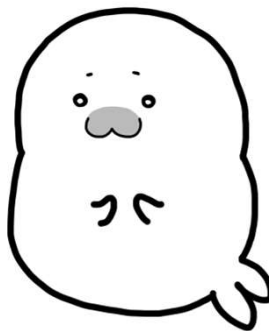
ひょうが アザラシの氷河くん

ひきこもりの子どもを持つ親同士がさまざまな想いを話し合える集まりを開催したり、本人が家以外に自分らしく安心して自由に過ごせる居場所支援やひきこもりに関する相談に乗っている。