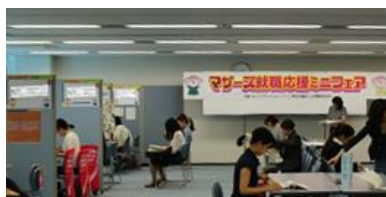
マザーズ就職応援ミニフェアの様子

平成27年9月11日(金)に、あいちマザーズハローワーク主催による「マザーズ就職応援ミニフェア」を開催しました。今回は、マザーズハローワークとして初めての「事務職限定」の就職フェアで、企業12社に対し、子育て中の女性等71名が来場し、各ブースにおいて説明を受けました。また、同時開催のセミナーにも16名の方が参加し、企業に応募する前の心構えについて受講しました。