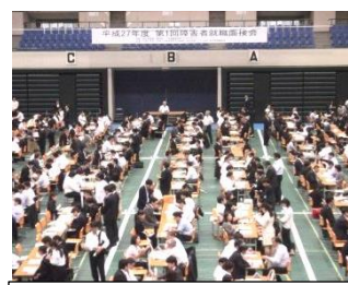
障害者就職面接会の様子

また、障害者雇用に積極的な2企業の事例紹介と28年4月1日に施行予定の改正障害者雇用促進法について解説を行い、障害者雇用への理解を求めました。