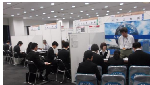
愛知ブランド企業・若者応援宣言企業 秋の就職フェア2015の様子

参加企業のアンケートには「前向きな方が多くいた」、「大変有意義でした」、「弊社に興味を持ってもらう良い機会となりました」、「この時期のイベント開催は毎年ありがたいと感じております」といった感想が寄せられました。