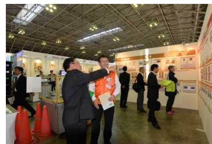
緑十字展の愛知労働局ブース

愛知労働局関係のイベントとしては、吹上ホールで開催された緑十字展で、東海4県の事業場から募集した労働安全衛生対策を紹介するブース（「未来（あした）の確かさ～論理的な安全衛生管理の推進・定着～」）を出展しました。また、10月29日には、同じく吹上ホールにて、「過重労働防止から『働き方改革』まで」と題した愛知労働局及び企業の取組を紹介しました。何れのイベントも盛況で、多くの方にご覧いただくことができ、大会全体としても成功裏に終わることができました。来年度の大会は、宮城県において開催されます。次回も多くの方のご参加を期待しています。