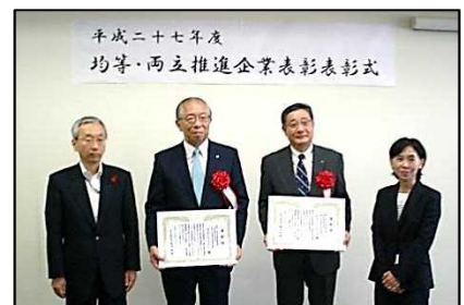
受賞者と労働局長、雇用均等室長