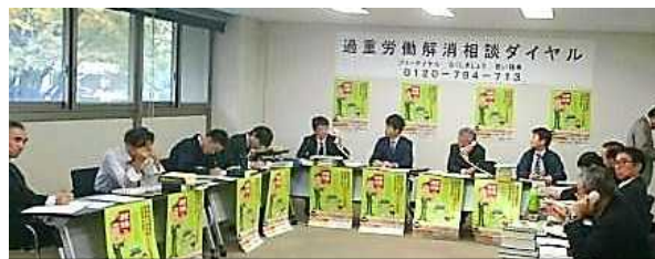
過重労働解消相談ダイヤルの相談を受ける労働局職員

また、11月7日には過重労働解消相談ダイヤル（全国一斉無料電話相談）を行い、9時から17時まで労働基準監督官23名が対応しました。当日はテレビ局2