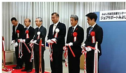
みよし市就労支援センター開所式テープカット

ジョブサポートみよしでは、地域住民の生活の安定と就職・再就職の促進を図るため、市が行う就労支援サービスと愛知労働局（ハローワーク）が行う職業相談や職業紹介などを一体的に実施することにより、利用者に対する総合的な就労支援サービスを行います。職業相談員による職業相談や職業紹介を受けることができる他、ハローワークと同じ求人情報提供端末が設置され、求人情報の検索などが可能です。