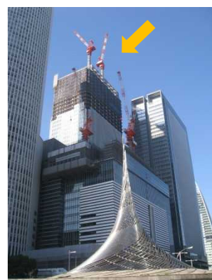
建設中のJRゲートタワー

また、今年度は年末安全衛生推進運動期間に合わせ、12月9日には局長による介護施設安全衛生パトロールも実施することとしています。介護施設については、労働災害が増加する傾向にあり、今般初めて局長による安全衛生パトロールを実施することとしたものです。（介護施設安全衛生パトロールの結果については、次号に掲載する予定です。）