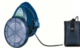
電動ファン付き呼吸用保護具