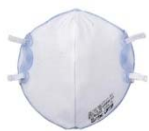
使い捨て式防じんマスク

がれきの粉じんには石綿が含まれているおそれがあります。事業者の指示に従い、適切なマスクの着用をお願いいたします。