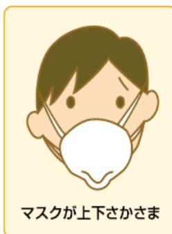
マスクが上下さかさま