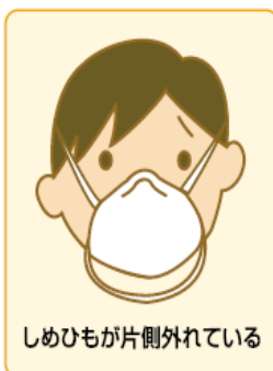
しめひもが片側外れている