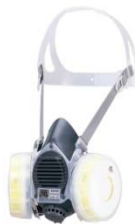
取替え式防じんマスク