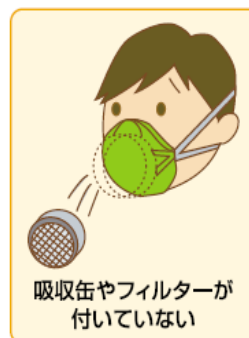
吸気弁やフィルターが付いていない