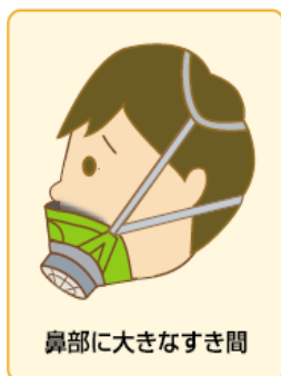
鼻部に大きなすき間