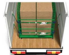
ラッシングベルト